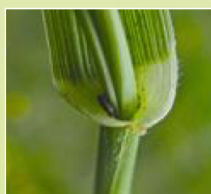
Oortjes met korte wimpers