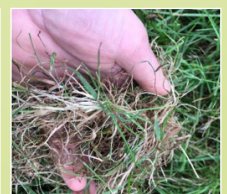
Witte voet/natte grond